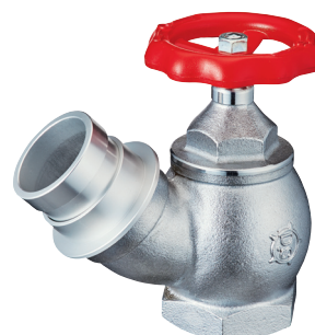
DV-312 65A×45° 差込式