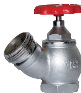
DV-312N 65A×45° ネジ式