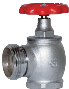
DV-465N 65A×90° ネジ式