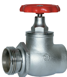
DV-464N 65A×180° ネジ式