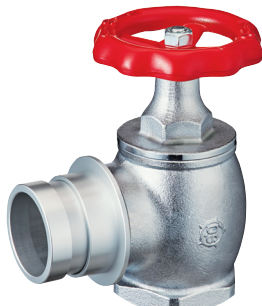
DV-465 65A×90° 差込式