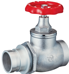
DV-464 65A×180° 差込式