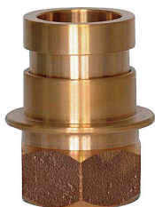
DFE-02 易操作性用媒介 ファイン 30A消防ネジ女×40町ノ男