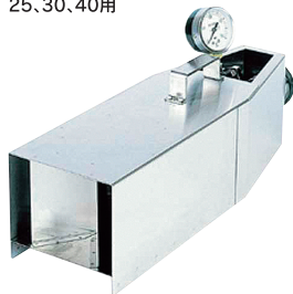
DFE-102 圧力測定器用ユニット ファイン 25, 30, 40用