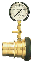
DAS-01 中間圧力測定器 40~65 町ノ式