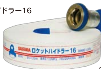
DH65-R16 ロケットハイドラ-16