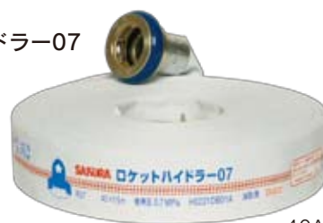
DH40-R07 ロケットハイドラ-07