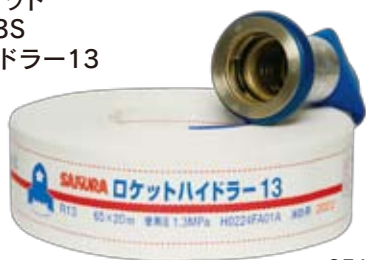
DH65-R13 スーパーロケット アドバンス13S ロケットハイドラ-13